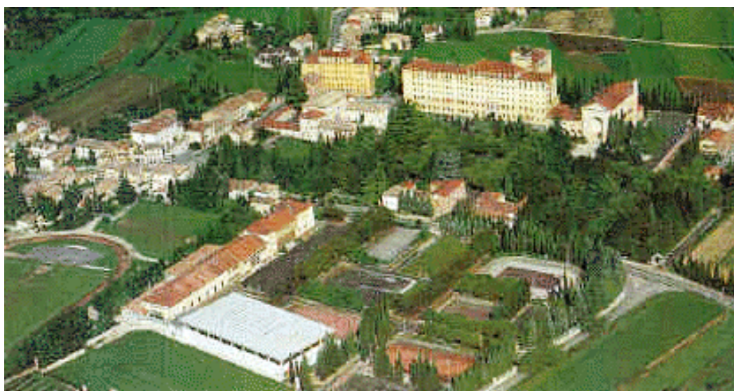
Foto dell' Istituto Filippin , dove saremo ospitati durante il torneo. Si trova a Paderno del Grappa (TV) . È diretto dai Fratelli delle Scuole Cristiane. Il vasto parco separa il centro scolastico dal villaggio sportivo.

I partecipanti riceveranno ulteriori informazioni.